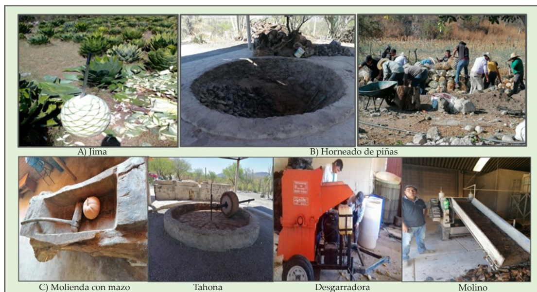
Figura 2. Proceso de elaboración de mezcal.

E) La destilación. Fase que los maestros mezcaleros denominan el “hilo de la paciencia”, por el tiempo empleado en el proceso. Después de fermentado el gabazo, el mosto