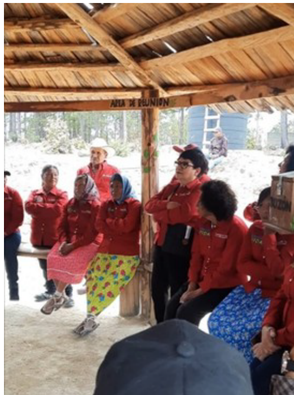
Figura 5. Reunión para los nuevos proyectos.