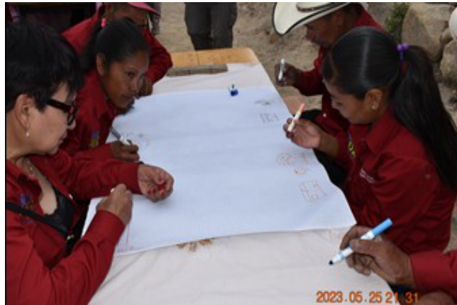
Figura 4. Trabajo en equipo sembrador@s en Nacarare.