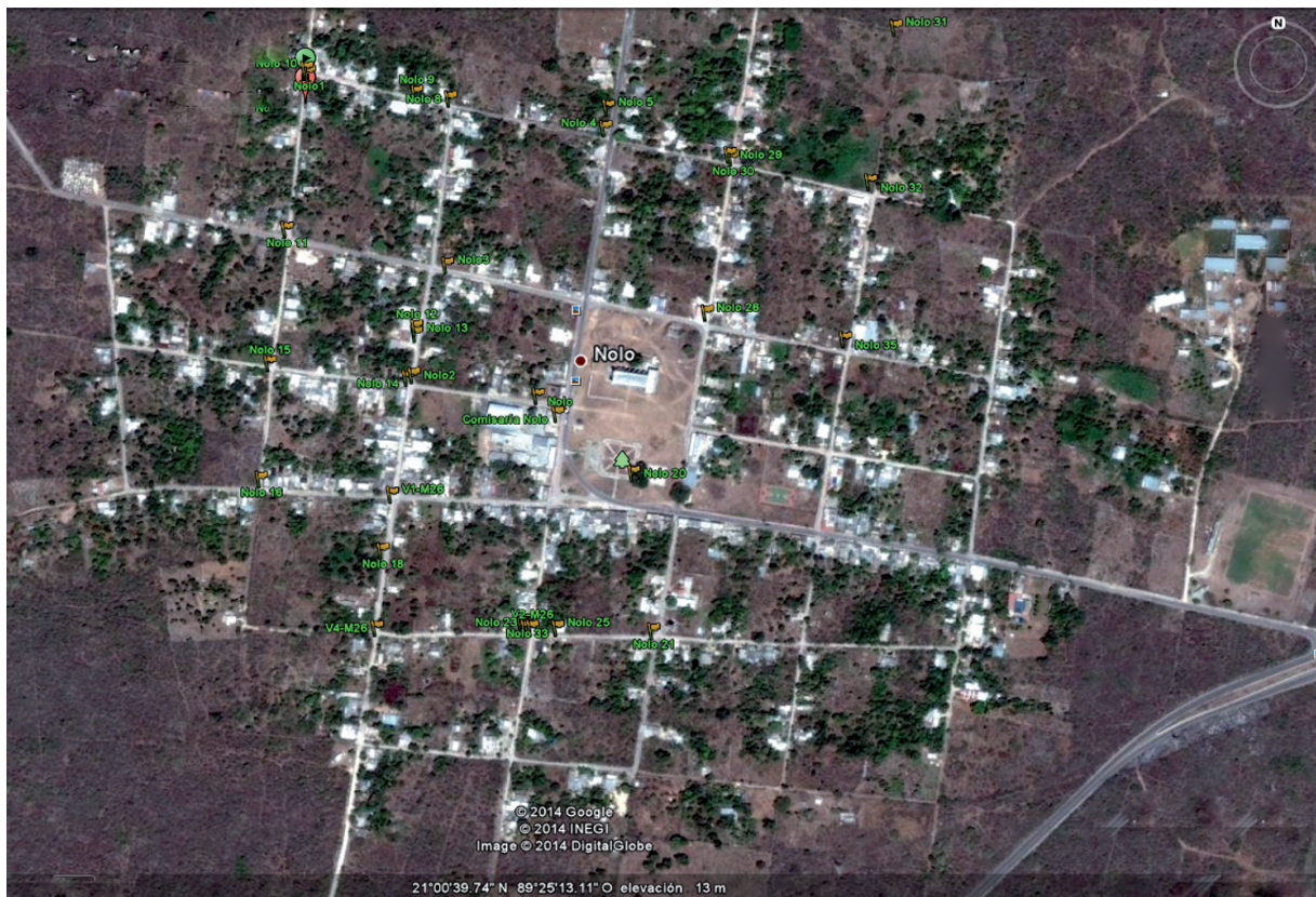
Figura 1. Localidad de Nolo, municipio de Tixkokob. Figure 1. Locality of Nolo, municipality of Tixkokob.

socioeconómica de la población está resumida por el coeficiente de marginación ( -0.713097137 ), el cual es alto (INEGI, 2013; CONAPO, 2013).